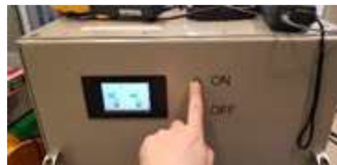
그림 3. Key Switch

DC콤보 충전 호환형 배터리는 일반 전기차 배터리와 다르게 자체 배터리 감시 시스템이 필요하였다. 왜냐하면 전기차 배터리는 차량 내부에 배터리 감시 UI가 있어 전압 및 온도 등을 운전자가 실시간으로 감시 할 수 있지만 호환형 배터리의 경우 차량이 없기에 배터리 자체적으로 LCD를 부착하거나 검수용 PC를 통해 위 기능을 수행해야했다. 또한 충전 단자 아래에 계전기를 장착하여 충전 시 사용자가 배터리에서도 충전 스위치를 눌러야 충전이 가능하도록 만들었다. 추가적인 기능으로는 전기차의 Key Switch를 모의하였는데 전기차는 일반적으로 시동과 동시에 내부 BMS를 ON 시키고 시동이 꺼지면 BMS를 OFF 시킨다. 자체적으로 만든 Key Switch가 켜져 있을 동안 배터리의 소모전류가 약 100~600mA 생기며 위 소모전류 가장 큰 원인은 계전기가 불을 때 400mA의 전류를 지속적으로 흘러줘야 했는데 이를 개선하기 위해 항상 붙어있는 계전기를 사용자가 충전하지 않을 때 떼어놓아 소모전류를 줄일 수 있었다.